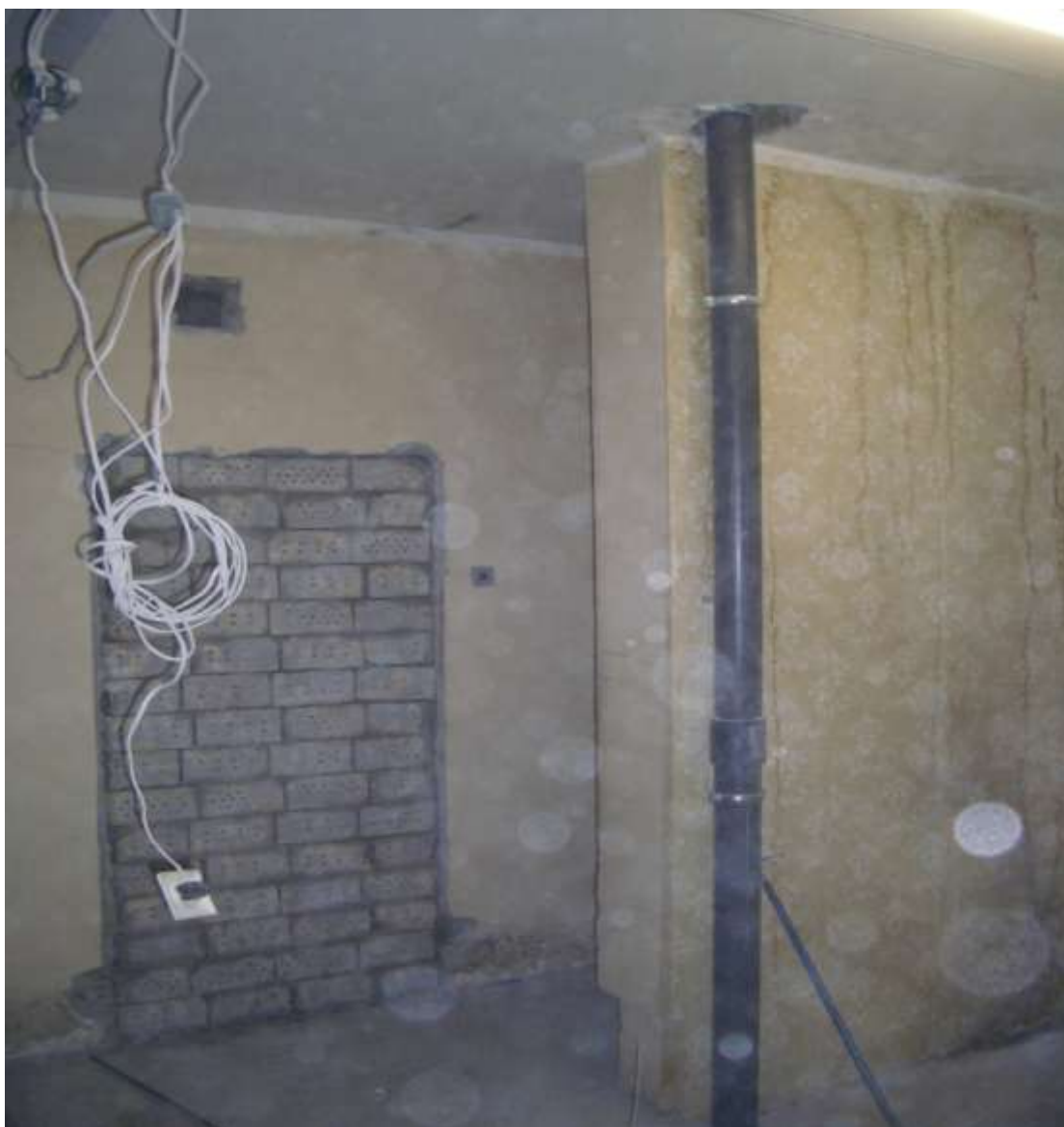
Jauno cauruļvadu montāža, sienu apšuvums